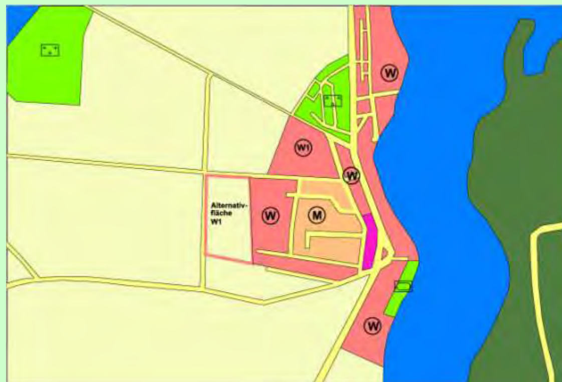
Abb. 3: Änderung Flächennutzungsplan – Alternativstandorte