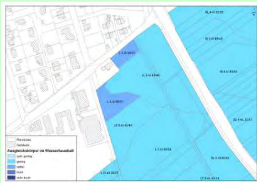
Abb. 8: Bewertung der Bodenteilfunktion Ausgleichskörper im Wasserhaushalt

Die meisten Böden im Plangebiet weisen eine geringe Leistungsfähigkeit für diese Bodenteilfunktion auf. Die beiden Teilflächen, die auch für die Bodenteilfunktion „Natürliche Bodenfruchtbarkeit“ mit „hoch“ eingestuft sind, weisen diesen Wert auch für die Bodenteilfunktion „Ausgleichskörper im Wasserhaushalt“ auf (vgl. Abb. 8).