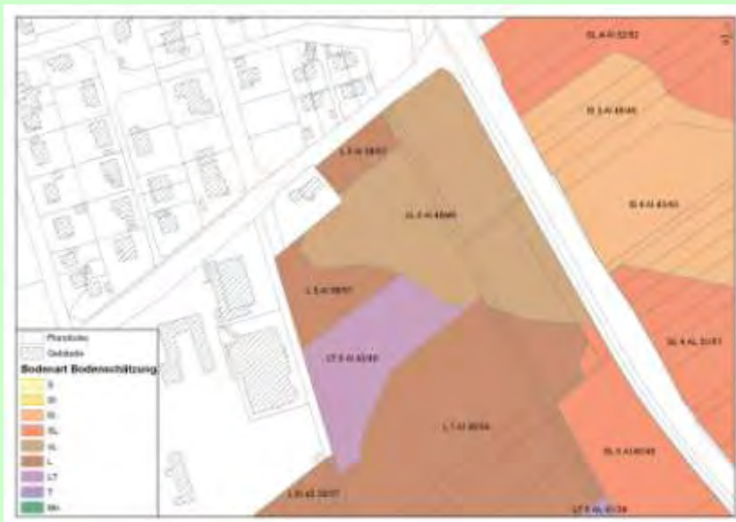
Abb. 6: Daten der Bodenschätzung als Daten Grundlage zur Bodenfunktionsbewertung

Böden mit Grünlandschätzung kommen im Plangebiet nicht vor.