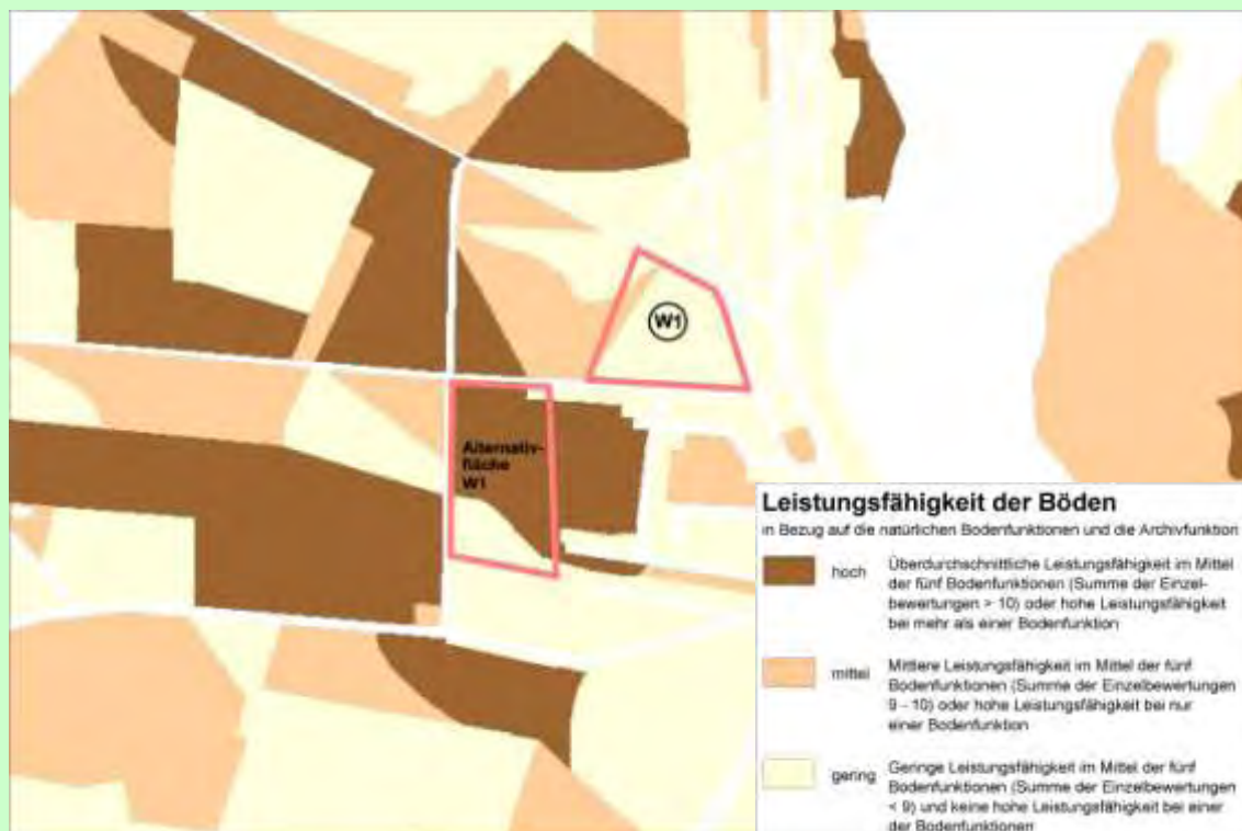
Abb. 4: Änderung Flächennutzungsplan – Leistungsfähigkeit der Böden

[...Darstellung der einzelnen Bodenfunktionen...]