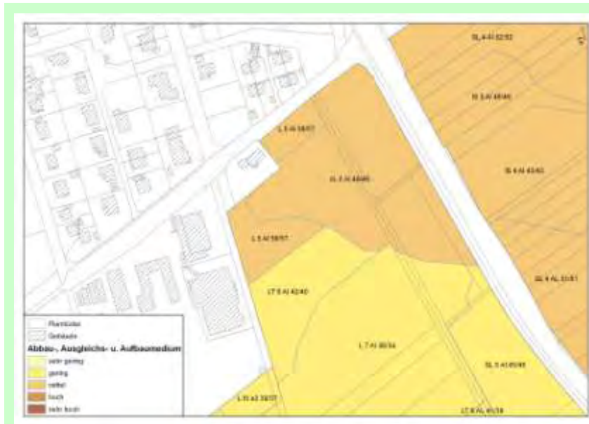
Abb. 9: Bewertung der Bodenfunktion Abbau-, Ausgleichs- und Aufbaumedium für Schadstoffe

Insgesamt weisen ein Großteil der Flächen für die Boden(teil)funktionen „Ausgleichskörper im Wasserhaushalt“ und „Abbau-, Ausgleichs- und Aufbaumedium für Schadstoffe“ eine geringe Leistungsfähigkeit bzw. bei der „Natürlichen Bodenfruchtbarkeit“ eine mittlere Leistungsfähigkeit auf. Nur bei zwei Teilbereichen im nordwestlichen Teil zeigen die Böden eine hohe Leistungsfähigkeit bei der „Natürlichen Bodenfruchtbarkeit“ und eine mittlere Leistungsfähigkeit bei den anderen beiden Boden(teil)funktionen.