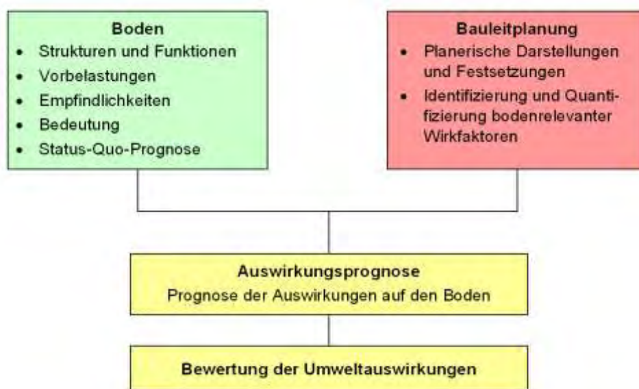
Abb. 1: Arbeitsschritte Auswirkungsprognose

wertung von Bodenfunktionen (vgl. Kap. 3.2) und wird zum einen bei Durchführung des Projekts (Planungsfall) und zum anderen bei Nichtdurchführung des Planvorhabens (Prognose-Nullfall) erstellt. Beim Prognose-Nullfall wird die planungsrechtlich aktuell schon zulässige Situation berücksichtigt. Aus der Bewertungsdifferenz zwischen Planungsfall und Prognose-Nullfall ergeben sich die Planungsauswirkungen.