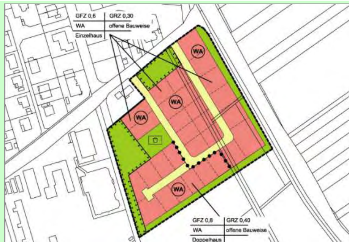
Abb. 5: Bebauungsplan eines Wohngebiets im Außenbereich

Der Schwerpunkt des Fallbeispiels liegt in der Bewertung der einzelnen Bodenfunktionen und der darauf aufbauenden Steuerung des Versiegelungsgrades durch Festsetzungen im B-Plan und durch Festlegung der Minderungsmaßnahmen. Weiterhin werden verschiedene Ausgleichsmaßnahmen für den Bodenschutz dargestellt und dem Eingriff verbalargumentativ gegenübergestellt.