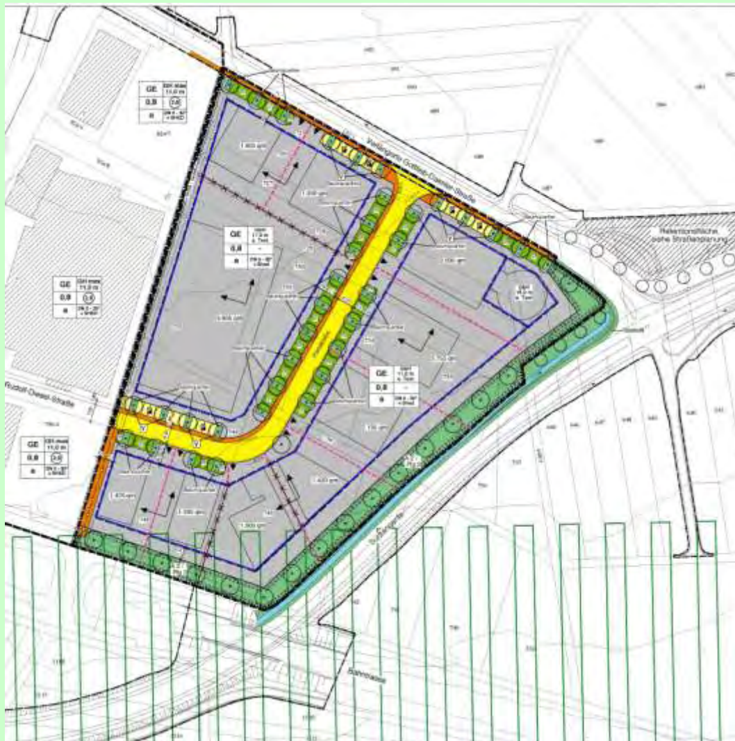
Abb. 10: Bebauungsplan Gewerbegebiet – Planung

Der Fokus des Fallbeispiels liegt auf der quantitativen Bilanzierung der Eingriffe in die verschiedenen Bodenfunktionen und der Darstellung des rechnerisch erforderlichen Ausgleichs.