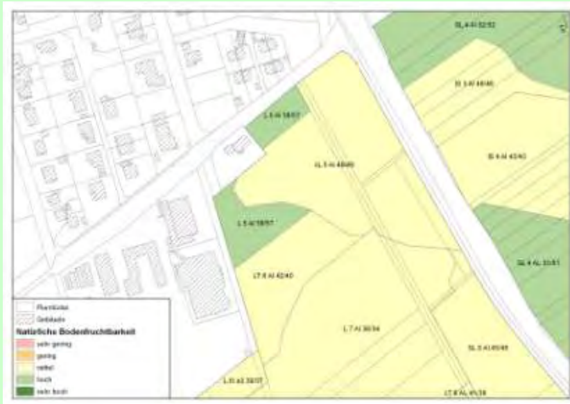
Abb. 7: Bewertung der Bodenteilfunktion Natürliche Bodenfruchtbarkeit

Im Plangebiet sind hauptsächlich Böden mit einer mittleren „Natürlichen Bodenfruchtbarkeit“ zu finden. Zwei Teilbereiche im nordwestlichen Teil weisen Böden mit einer hohen Leistungsfähigkeit dieser Bodenteilfunktion auf (vgl. Abb. 7).