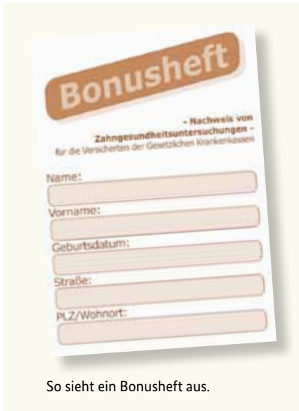
So sieht ein Bonusheft aus.

Gesunde Zähne sind ein Stück Lebensqualität. Deshalb sind regelmäßige Vorsorgeuntersuchungen wichtig – auch wenn Sie keine Beschwerden haben. Die gesetzlichen Krankenkassen übernehmen auch die Kosten dieser Vorsorgeuntersuchungen. Diese Untersuchungen helfen, bestimmte Erkrankungen frühzeitig zu erkennen und zu behandeln. Sie können dafür von Ihrer Krankenkasse ein sogenanntes „Bonusheft“ erhalten. In diesem Heft werden die Vorsorgeuntersuchungen eingetragen. Wenn Sie nachweisen können, dass Sie mindestens einmal im Jahr (unter 18 Jahren mindestens einmal pro Halbjahr) bei einer Zahnärztin oder einem Zahnarzt waren, zahlt die Krankenkasse einen höheren Zuschuss, sofern ein Zahnersatz notwendig wird.