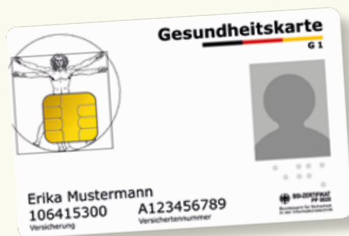
Esempio di tessera sanitaria.

Portate sempre con voi la tessera sanitaria quando vi avvalete di servizi sanitari. Dal 1° gennaio 2015 solo questa tessera ha valore come documento per godere delle prestazioni dell'assicurazione sanitaria pubblica. Sulla tessera sanitaria elettronica sono registrati i dati obbligatori: il vostro nome, la data di nascita, l'indirizzo, il numero di assicurazione e il vostro status (assicurato, assicurazione familiare o pensionato). Sulla tessera sanitaria elettronica c'è anche la vostra fotografia.