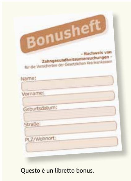
Questo è un libretto bonus.

I denti sani sono importanti per una buona qualità della vita. Per questo le visite preventive periodiche sono molto importanti – anche se non avete disturbi. Le casse malattia pubbliche coprono anche le spese per le visite di prevenzione. Queste visite aiutano a diagnosticare precocemente alcune malattie e a curarle. Per queste visite potete ricevere un cosiddetto libretto bonus (Bonusheft) dalla vostra cassa malattia. In questo libretto vengono registrate le visite di prevenzione. Se potete dimostrare di essere stati dal dentista almeno una volta l'anno (sotto i 18 anni almeno una volta ogni sei mesi), la cassa paga un contributo maggiore nel caso vi sia necessità di protesi dentarie.