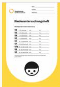
Questo è un libretto delle visite U.

Queste visite sono molto importanti. Per questo andate a tutte le visite e portate sempre con voi il libretto U e il libretto delle vaccinazioni del bambino. Queste visite aiutano a mantenere la salute del bambino.