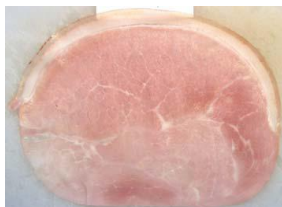
Bild 1 Hinterschinken

Bei Formfleisch-Schinken oder Formfleisch-Vorderschinken handelt es sich um Kochpökelwaren, die im Gegensatz zu Hinterschinken und Vorderschinken nicht aus Muskulatur im natürlichen Muskelverband hergestellt, sondern aus Muskelfleischstücken zusammengefügt werden (Bild 3). Damit der Verbraucher über die wahre Natur dieser Erzeugnisse nicht getäuscht wird, müssen geformte Kochpökelwaren entsprechend bezeichnet werden, z.B. als „Formfleischvorderschinken“. Dies gilt ebenso für Speisekarten, z.B. „Schinken-Pizza mit Formfleischvorderschinken, Tomaten, ...“.