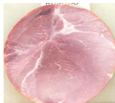
Bild 2 Vorderschinken