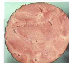
Bild 3 Formfleisch

Bei Hinter- und Vorderschinken erkennt man die natürliche Wuchsrichtung der Muskulatur und den natürlichen Muskelzusammenhang. Bei einem Formfleischerzeugnis sind die Größe der zusammengefügteten Muskelfleischstücke und ihre unterschiedliche Muskelfaserrichtung erkennbar.